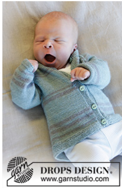
DROPS Baby 33-32

(40/44) 48/52 - 56/62 - 68/74 - 80/86 (92 - 98/104)