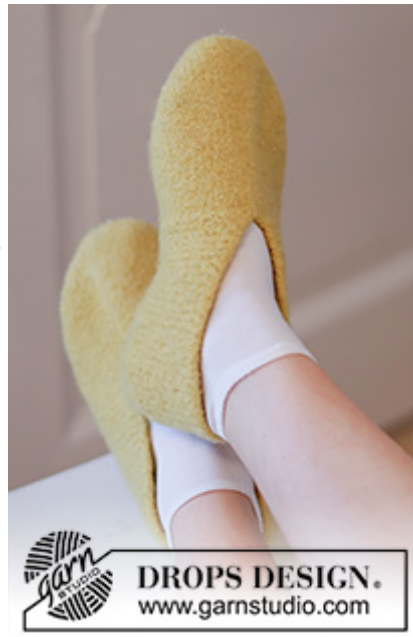
DROPS Extra 0-1535

Garnforbrug ved alternativt garn – Brug vores garn-omregner her