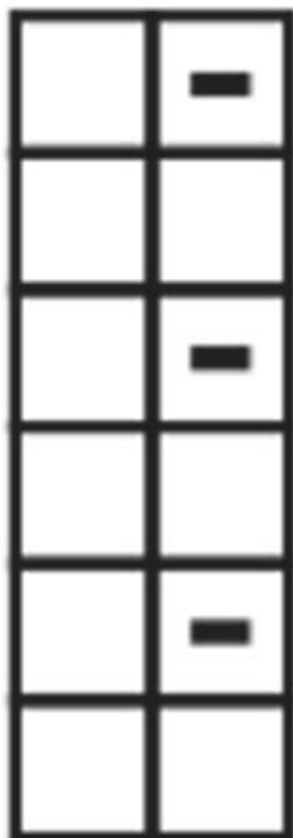
Diagram til DROPS 204-32