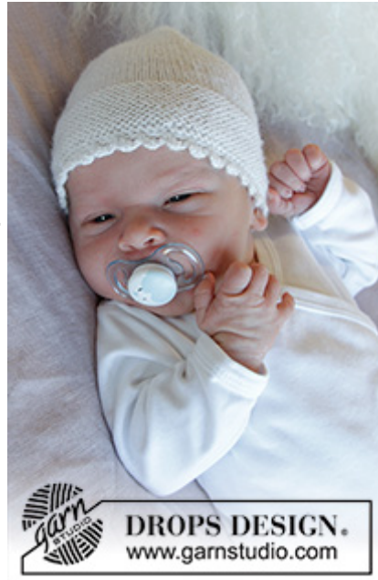
DROPS Baby 33-17

Garnforbrug ved alternativt garn – Brug vores garn-omregner her