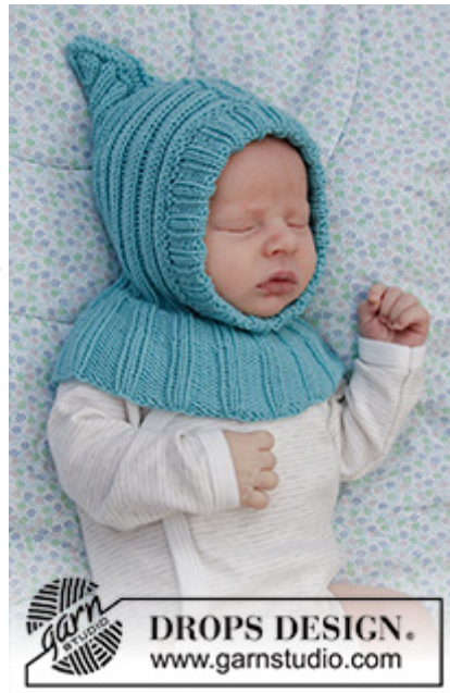
DROPS Baby 33-9

Størrelse: (<0) 0/1 - 1/3 - 6/9 - 12/18 mdr (2) år Størrelsen modsvarer ca barnets højde i cm: (40/44) 48/52 - 56/62 - 68/74 - 80/86 (92) Passer hovedmål: (28/32) 34/38 - 40/42 - 42/44 - 44/46 (48/50) cm