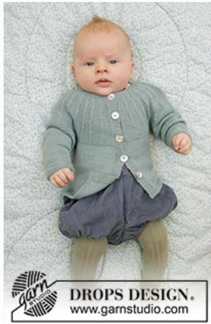
DROPS Baby 33-19

Garnforbrug ved alternativt garn – Brug vores garn-omregner her -----