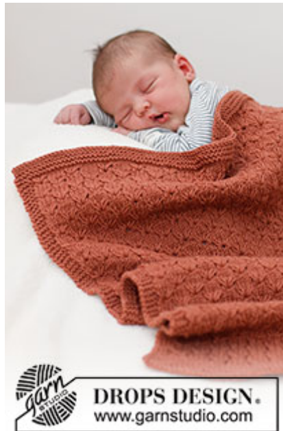
DROPS Baby 39-6

Garnforbrug ved alternativt garn – Brug vores garn-omregner her