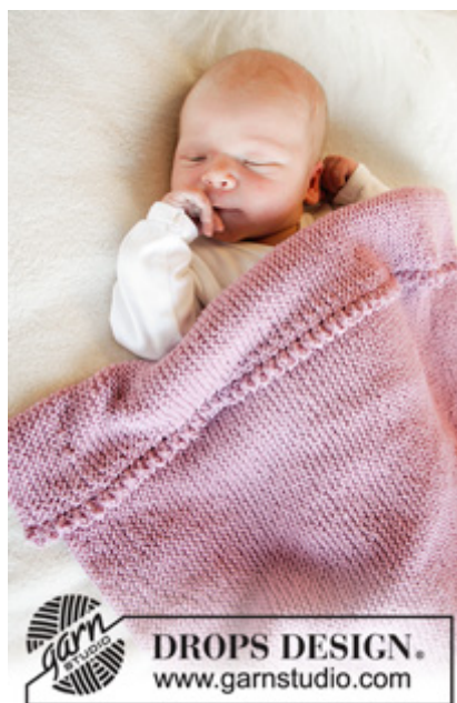
DROPS Baby 33-15

Garnforbrug ved alternativt garn - Brug vores garn-omregner her