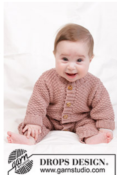
DROPS Baby 45-5

Garnforbrug ved alternativt garn – Brug vores garn-omregner her