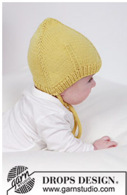
DROPS Baby 45-14

Garnforbrug ved alternativt garn – Brug vores garn-omregner her