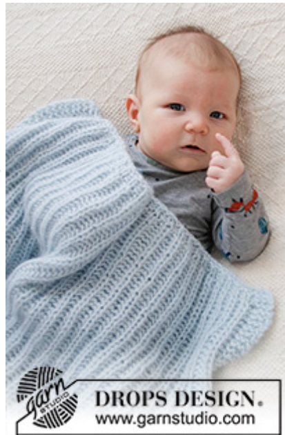
DROPS Baby 36-9

Strikkefasthed – Se hvorfor og hvordan du måler her Alternativt garn – Se hvordan du bytter garn her Garngruppe A til F – Brug samme opskrift og byt garn her Garnforbrug ved alternativt garn – Brug vores garn-omregner her